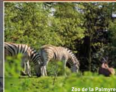
Zoo de la Palmyre