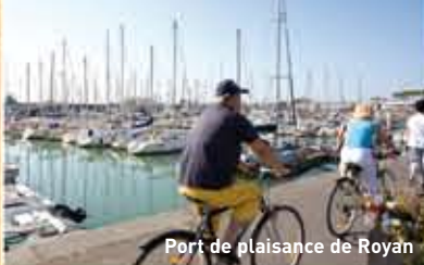
Port de plaisance de Royan