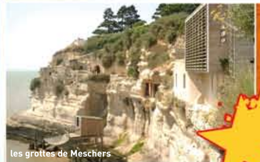
les grottes de Meschers